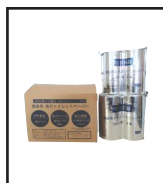
有限会社 丸英製紙