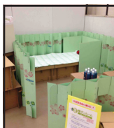
株式会社 タケナカダンボール