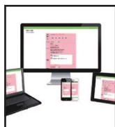
IT PRODUCT 株式会社