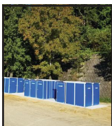
有限会社 四国浄管